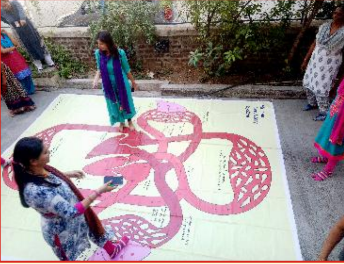
← વડોદરા જિલ્લાના શિક્ષકો માટે તાલીમ વર્ગ