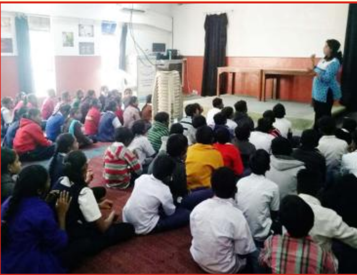
લોકવિજ્ઞાન કેન્દ્રની મુલાકાતે આવતા શાળાના વિદ્યાર્થીઓ