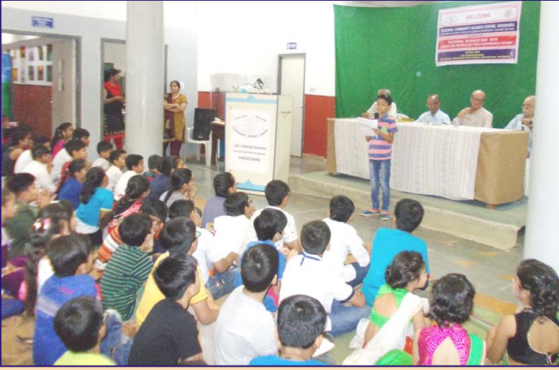
લોક વિજ્ઞાન કેન્દ્ર ખાતે રાષ્ટ્રીય વિજ્ઞાન દિનની ઉજવણી