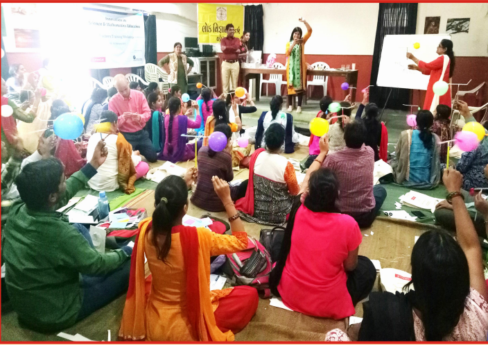
Innovative Science and Mathematics